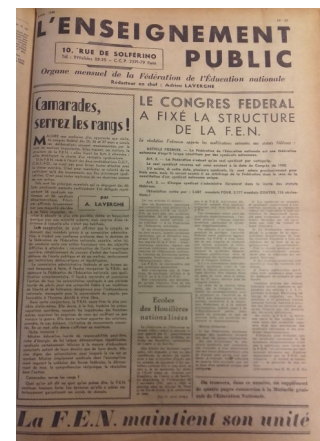
La F.E.N. maintient son unité

La FEN, dans une France socialement et politiquement divisée, fait donc le choix de l'unité et de l'autonomie.